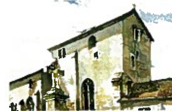
Eglise de Champouigny