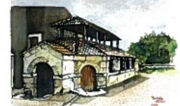
Lavoir de Taillancourt