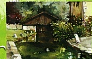
La Vaise à Maxey