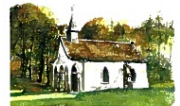
Epiez-sur-Meuse - Chapelle Ste-Anne

2. Tourner à gauche, traverser la D 960 et continuer sur le chemin d'en face. A partir de cet endroit, suivre le balisage du "sentier Jehanne d'Arc".