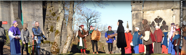
Mise en page : Ville de Vaucouleurs - Dessin Jeanne d'Arc - Christophe Maho - Ne pas jeter sur la voie publique.